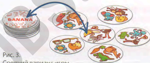
Рис. 3. Средний вариант игры

Задача игроков — находить на столе жетоны с картинками, названия которых написаны на его верхнем жетоне. Забирая жетон в стопку, игрок кладёт его так, чтобы видеть написанное на нём слово и подбирать к нему новый жетон.