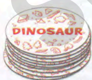
Набор с длинными словами