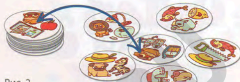
Рис. 2. Начальный вариант игры

Все жетоны на столе лежат картинками вверх, игроки смотрят свои жетоны тоже со стороны картинок. Задача игрока — найти парный жетон с такой же картинкой (хотя бы одной!), забрать его к себе в стопку картинок вверх, и искать теперь пару к нему.