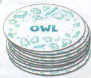
Набор с короткими словами