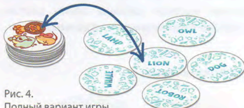
Рис. 4. Полный вариант игры

Все жетоны на столе лежат словами вверх, а игроки смотрят на свои жетоны со стороны картинок. Задача игроков — находить на столе жетоны с названиями картинок, нарисованных на верхнем жетоне в своей стопке.